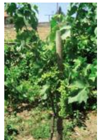
>> "Bio" solo finché è nei grappoli.